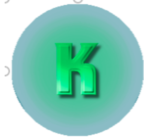
Arviointimaassa käytettäviä symboleja