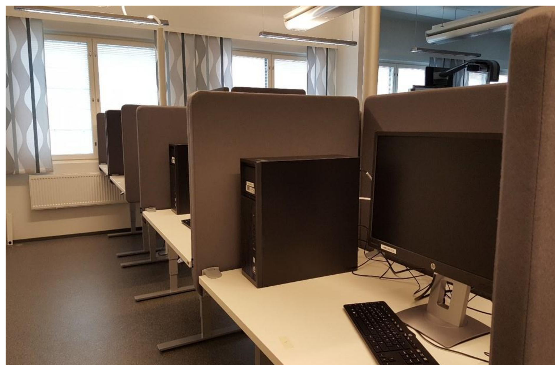
EXAMin tenttitilan käyttöön ottaminen 2017