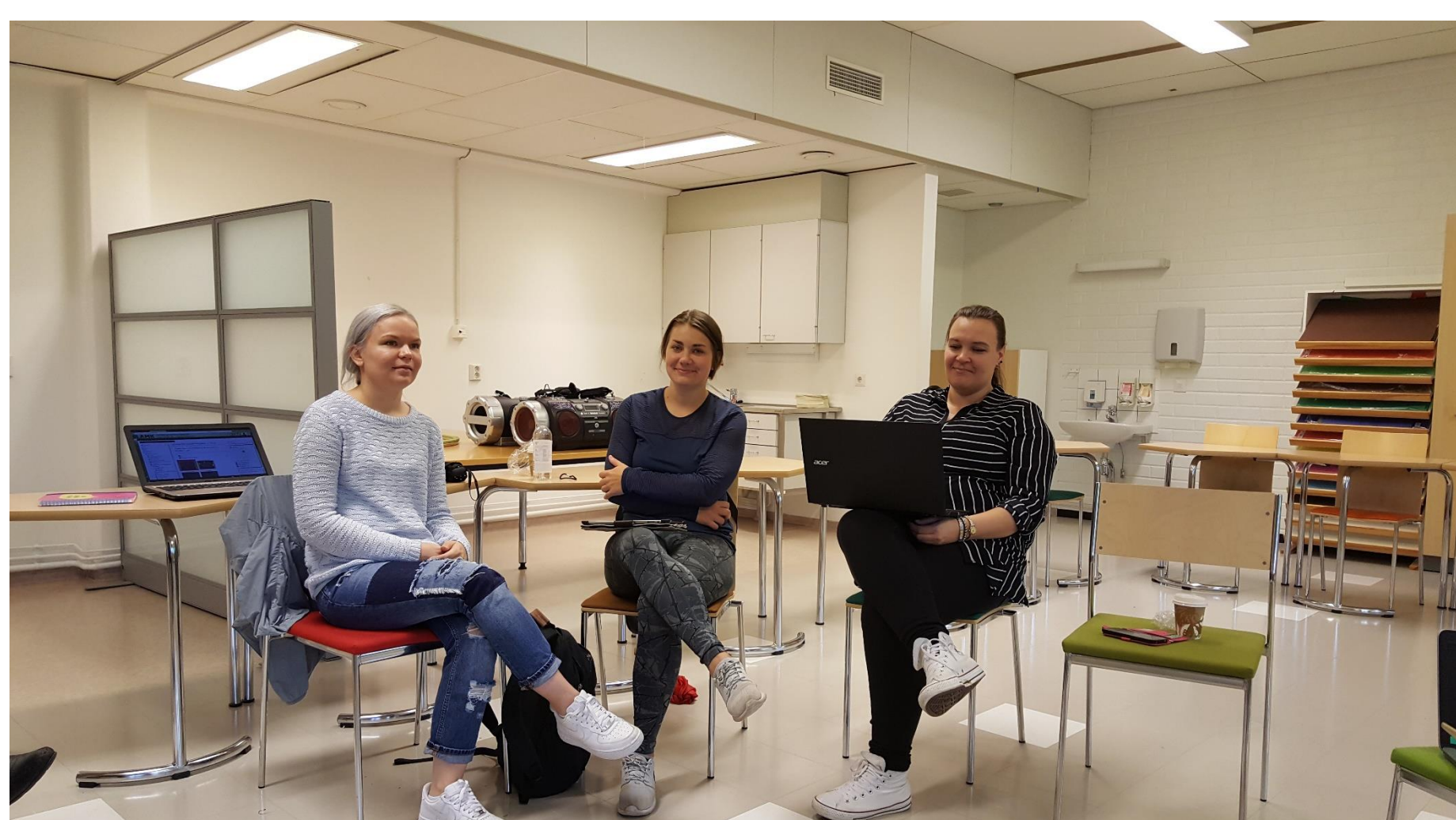
Projektin käynnistyminen syyskuu 2016